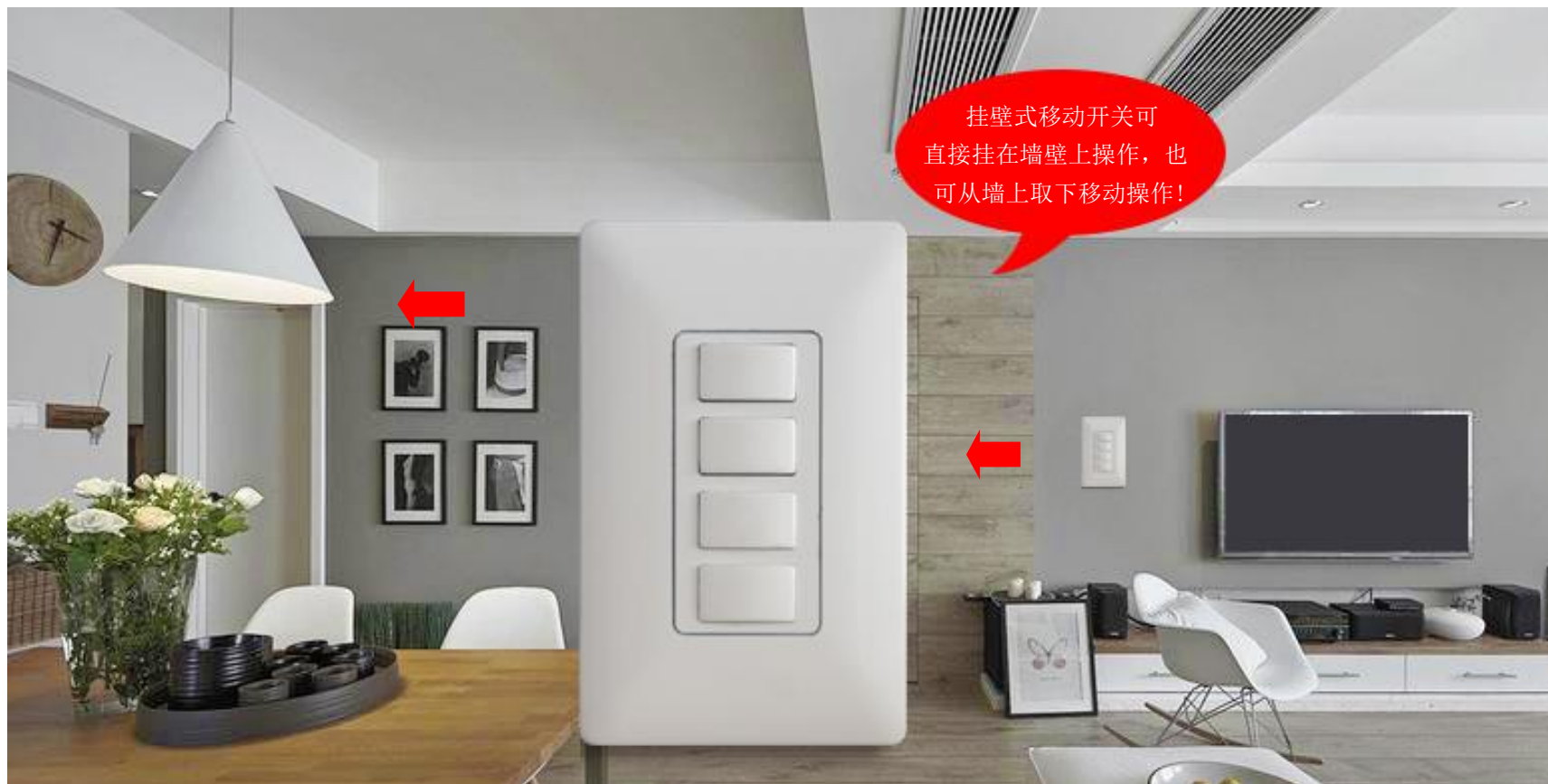
图一 挂壁式移动开关示意图