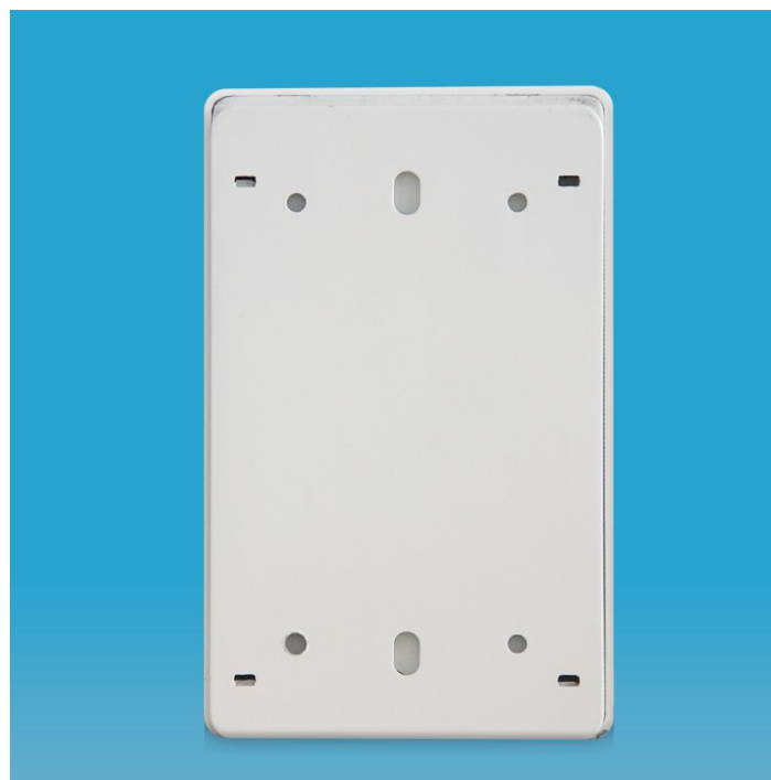
图四 产品背面结构图