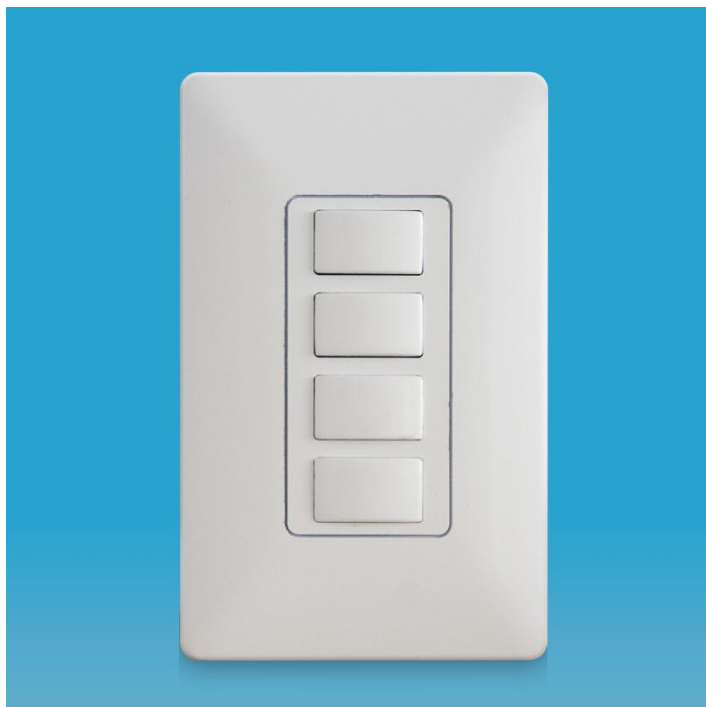
图三 产品正面结构图