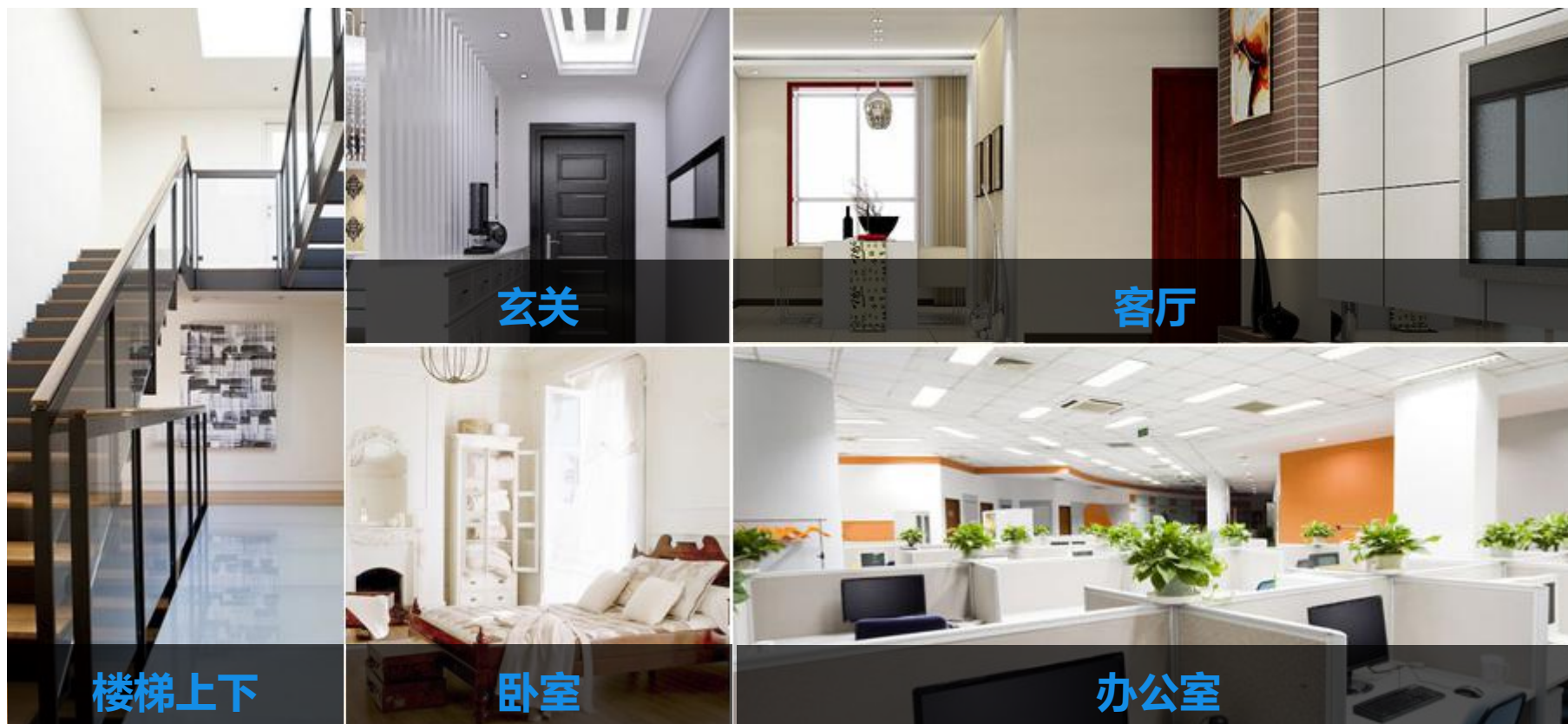
图二 产品适用场景示意图