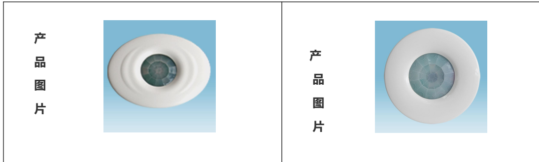
吸顶式声光控开关一览表