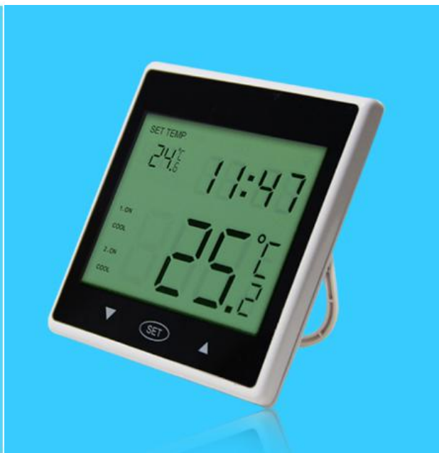
图三 产品侧面结构