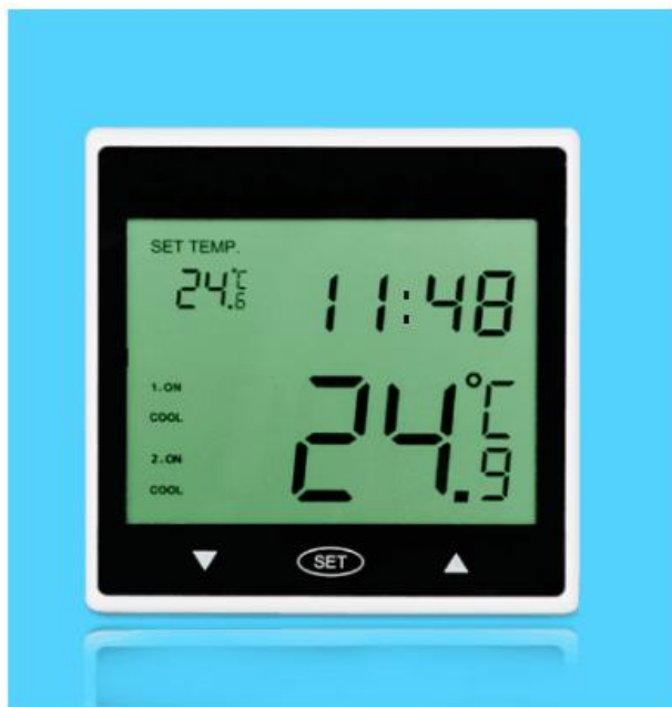
图二 产品正面结构