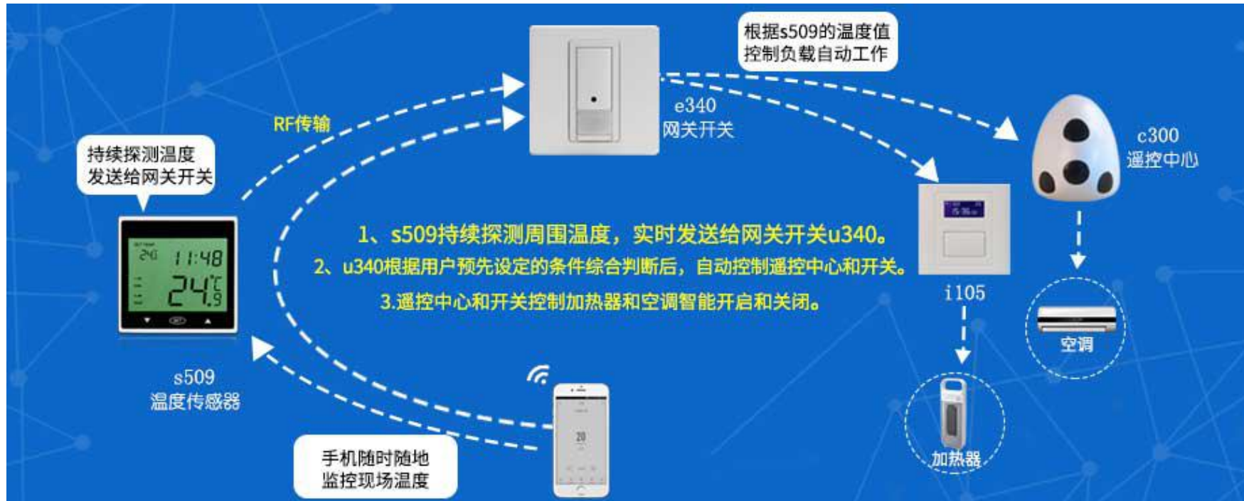
图一 产品工作示意图