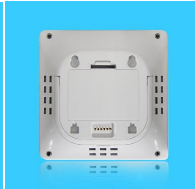
图四 产品背面结构