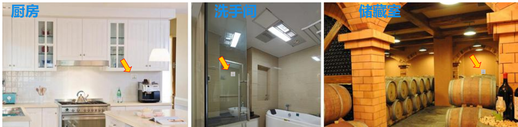
图一 产品适用场景示意图

2、排风扇延时关：排风扇工作期间，人离开后关闭照明，灯立刻熄灭，排风扇根据用户预先设定的延时时间，待环境彻底清新后，自动关闭电源。即保证排风彻底，也节能减排，避免排风扇的无效运转。