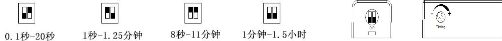
图六 延时关闭时间调节示意图