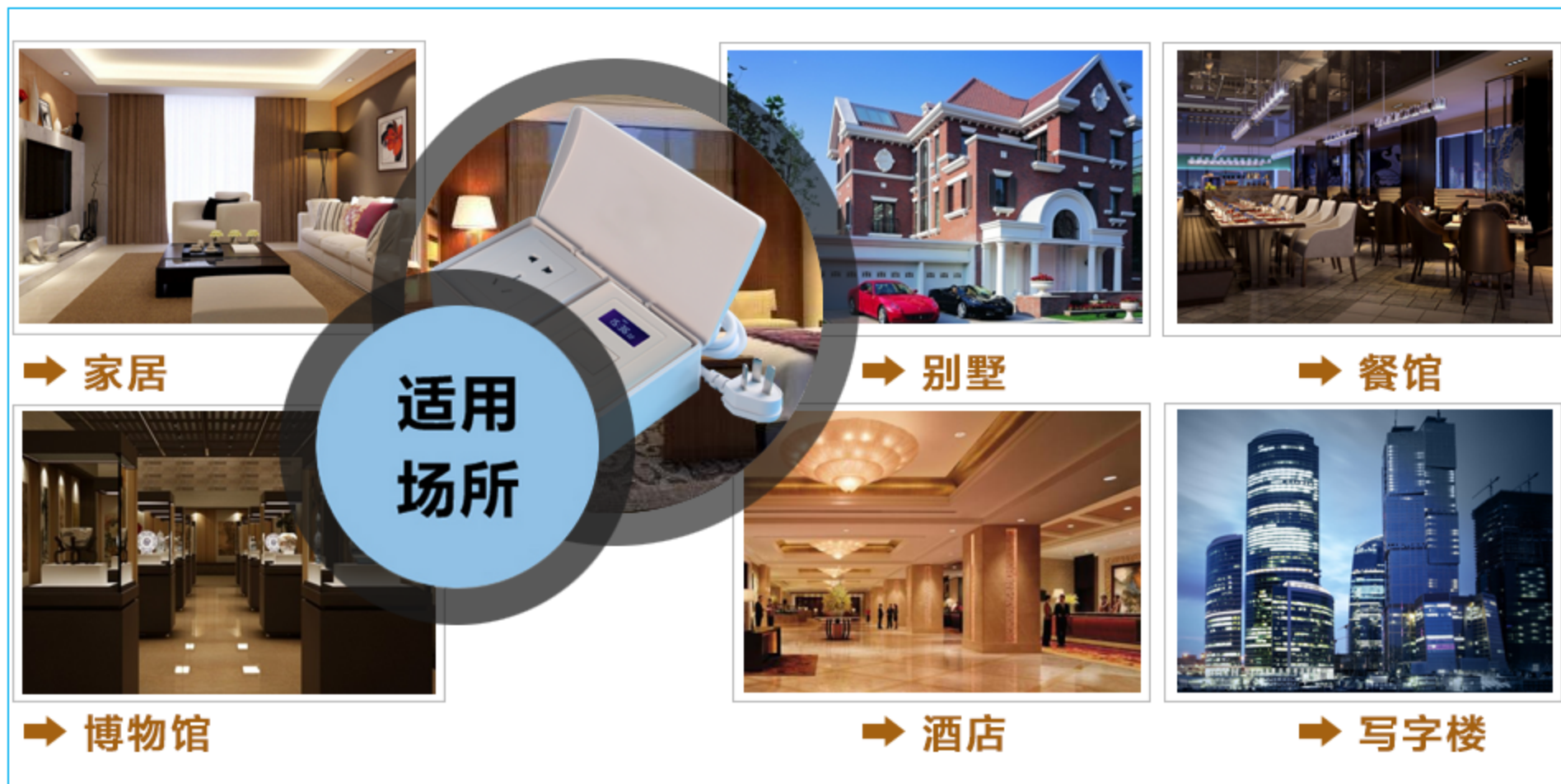
图一 产品适用场景示意图

也实现了远距离遥控功能。此插座所能控制的设备众多，如台灯、落地灯、风机、取暖器及各种大功率设备等。