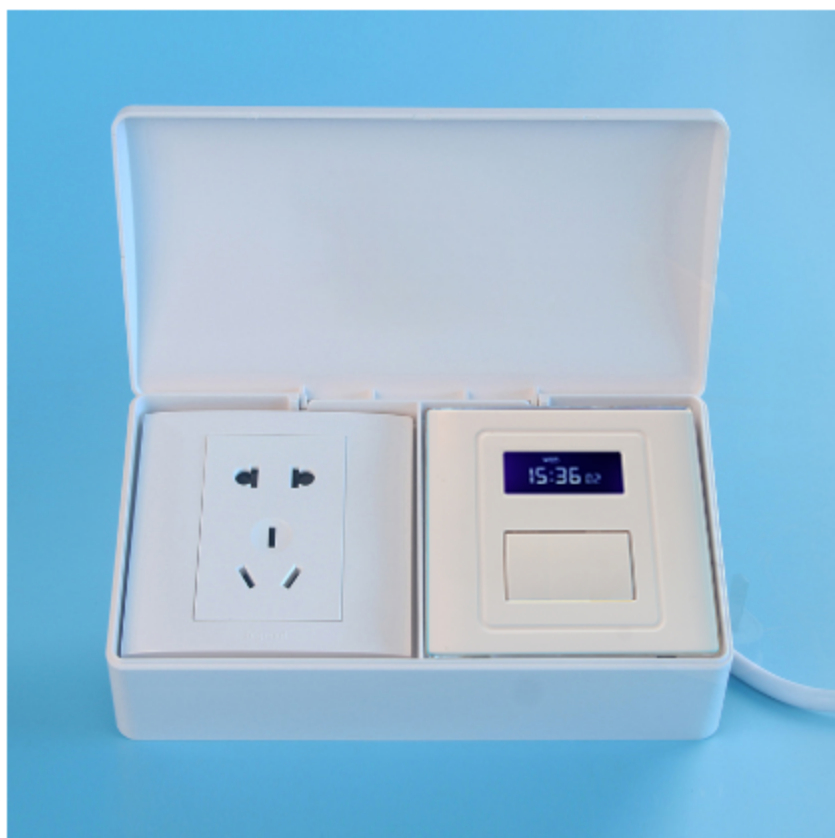
图二 产品正面结构图