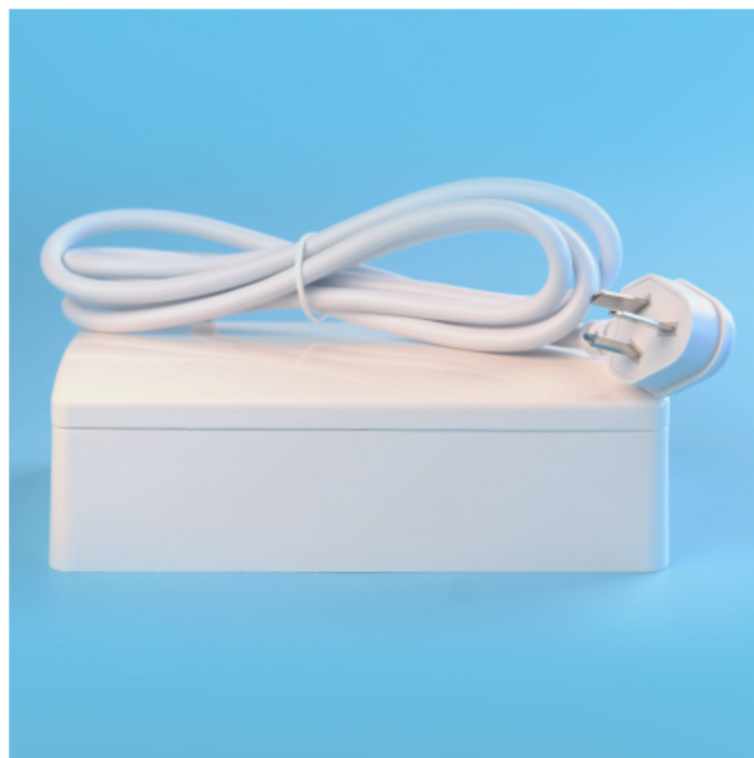
图三 产品背面结构图