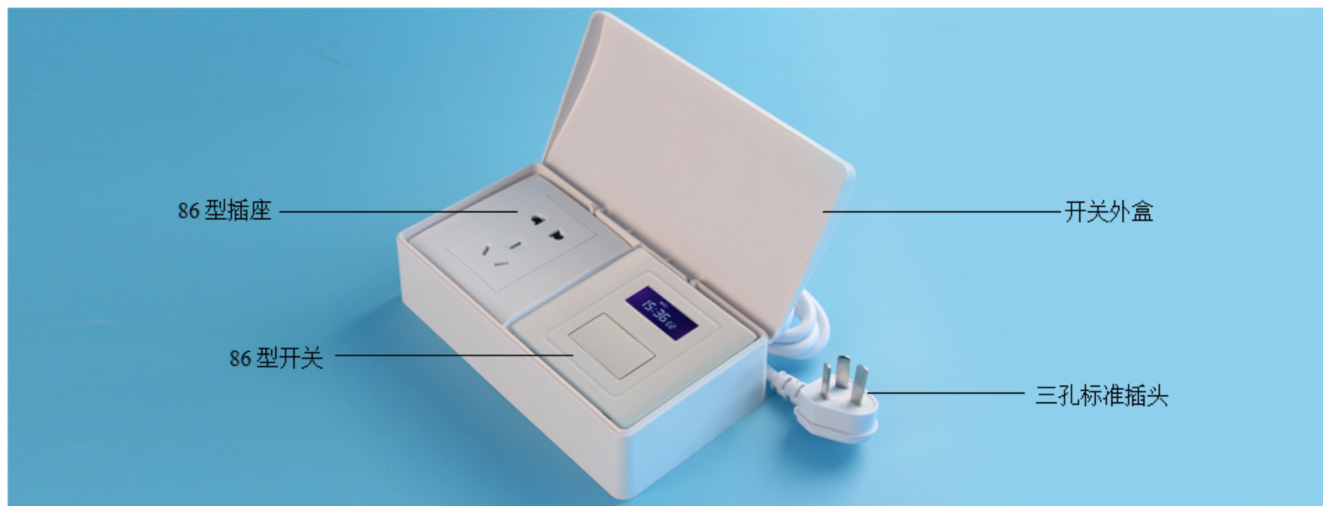
图六 开关面板示意图